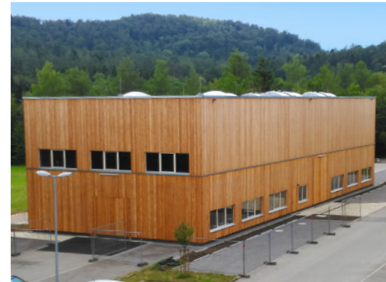
Schadenweilerhof, 72108 Rottenburg am Neckar